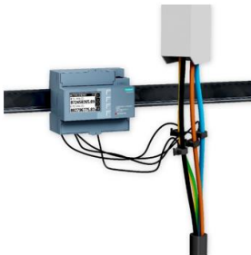
Phoenix Contact EEM-MB371-EIP